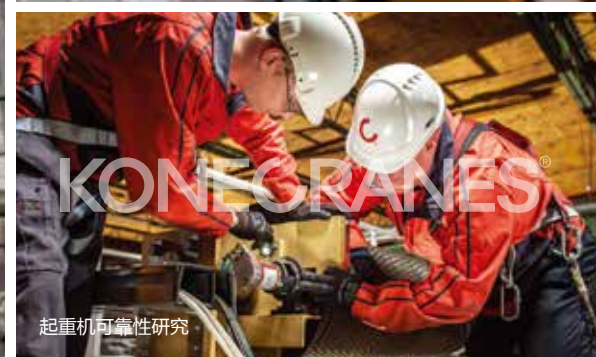
起重机可靠性研究