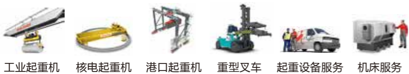
工业起重机 核电起重机 港口起重机 重型叉车 起重设备服务 机床服务