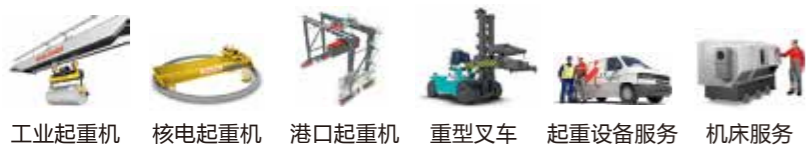
工业起重机 核电起重机 港口起重机 重型叉车 起重设备服务 机床服务